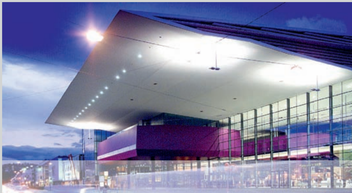
© mcg.at | Messe Congress Graz